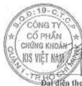
Đại diện theo pháp luật PARK WON SANG