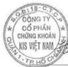
Đại diện theo pháp luật PARK WON SANG